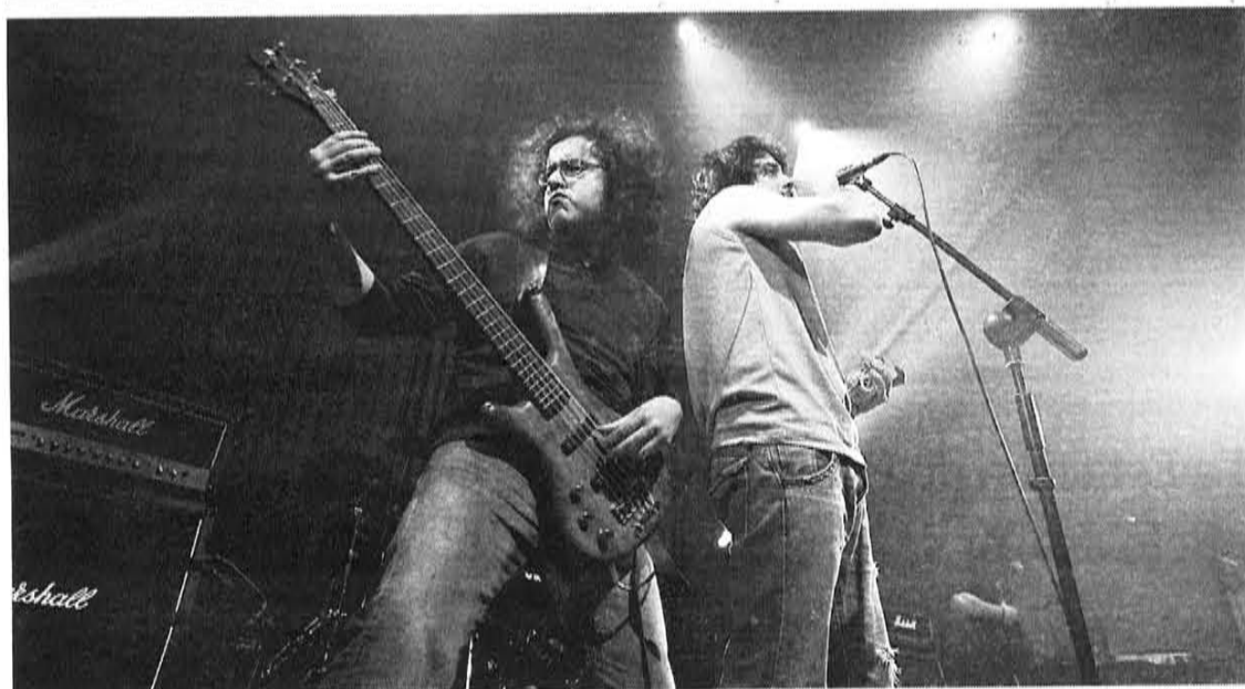
A banda metálica compostelana The Codename, ganadora da final de MúsicaXove, en plena faena

Antón Patiño reúne en «Rostros e labirintos», en la galería SCQ, su obra más reciente, pinturas en las que confluye su universo plástico y en las que siluetas humanas, formas y marañas abstractas se reactivan con el vibrante cromatismo que delimita espacio de la memoria.